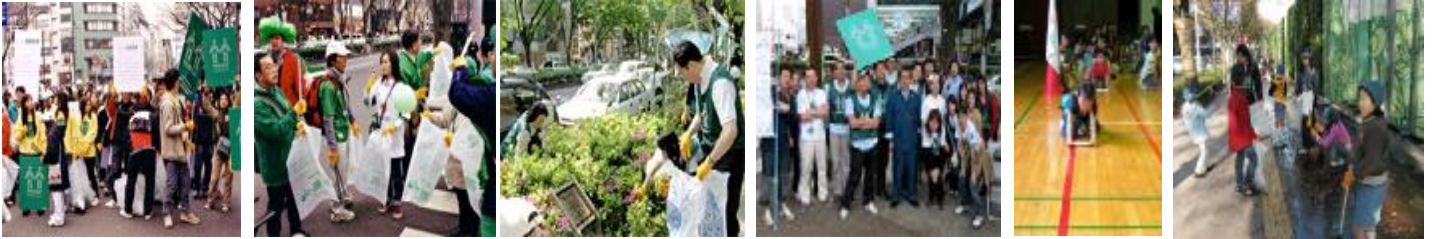
—ケヤキ祭— 平成15年4月18日